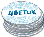
Набор с длинными словами