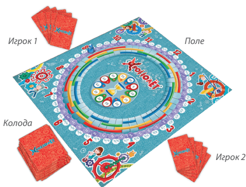
Начало игры, раздача

Цель игроков — выполнить больше всех дел в течение игры. Игроки ходят по очереди, по часовой стрелке. Первым ходит тот, кто сегодня встал раньше всех :)