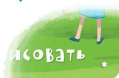
Отметка уровня сложности карт

В игре используются карты дел на 15, 30, 45 и 60 минут, отмеченные звёздочкой * и одна деревянная фишка.