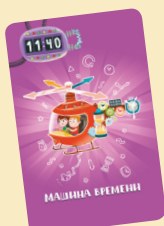
Карта машины времени

Если в игре используется карты для базового варианта (длительность кратная 15 минутам), то вам потребуются не все карты «машины времени», а только те, на которых минутный счётчик показывает «:00», «:15», «:30», «:45».