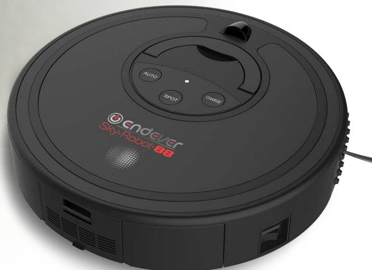
ENDEVER Sky Robot 88