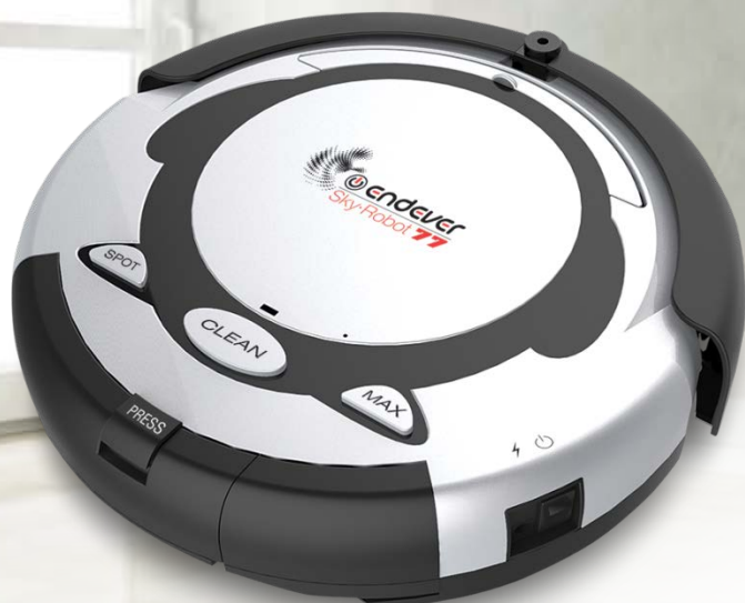
ENDEVER Sky Robot 77