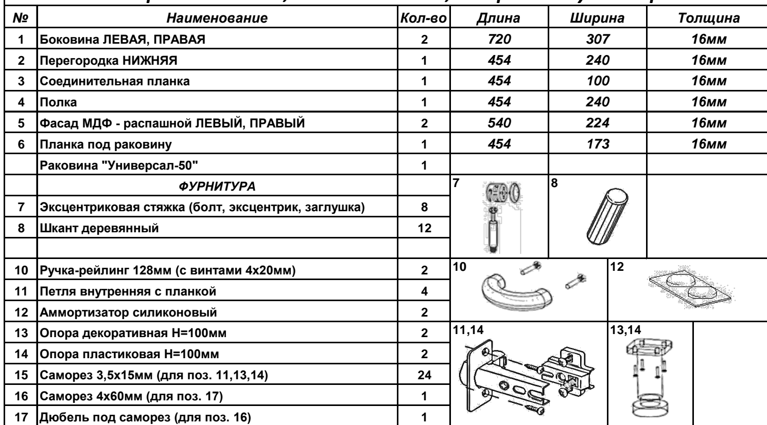
Схема сборки. Вн.Т-5010, 486x307x820мм, под раковину Универсал-50