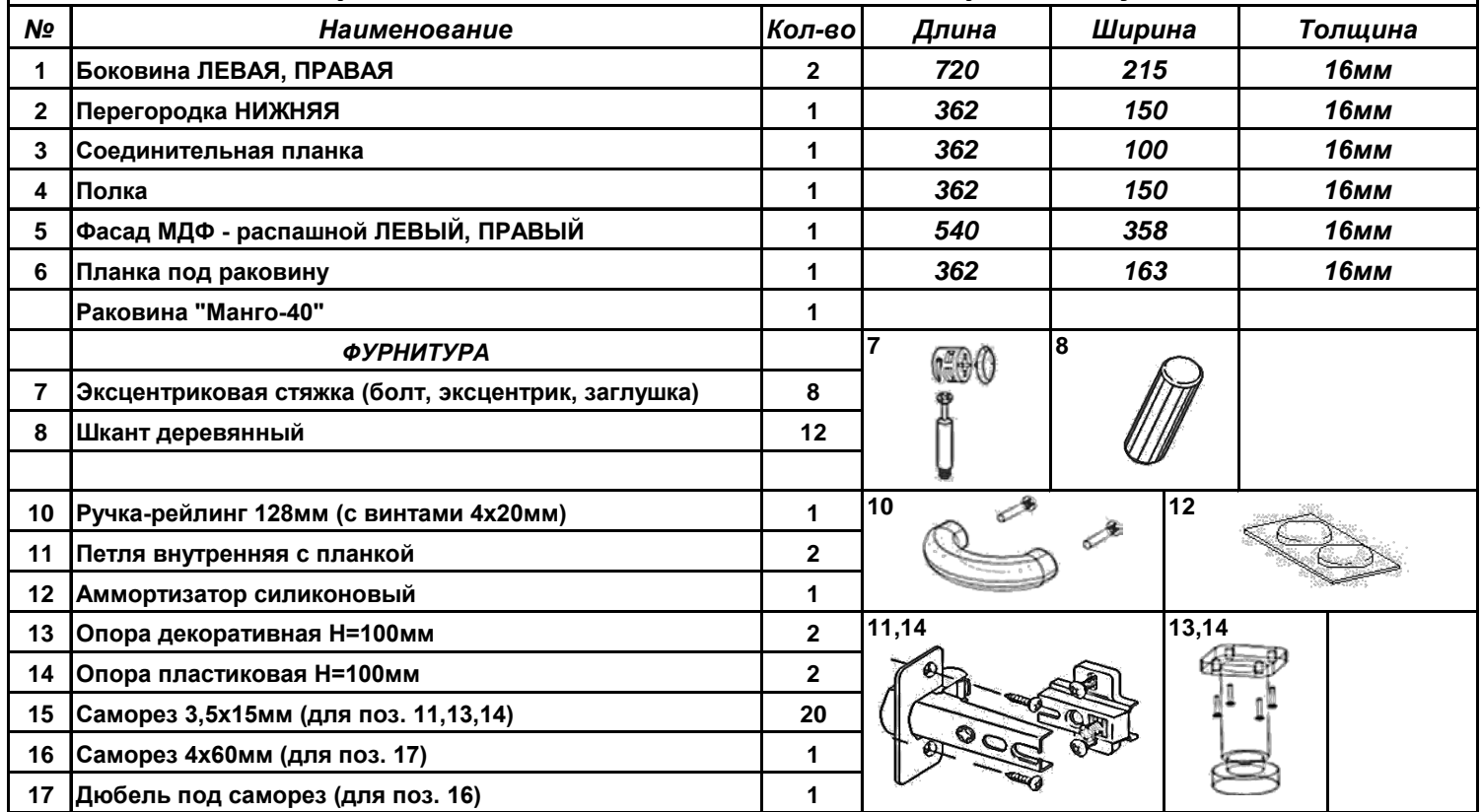
Схема сборки. Вн.Т-40, 394x215x820мм, под раковину Манго-40