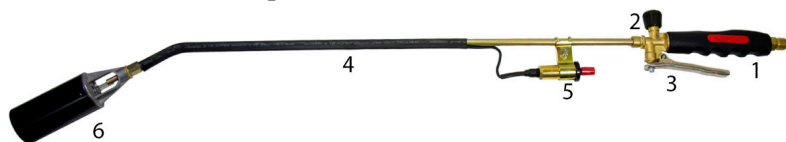
Рис. 1 Внешний вид горелки