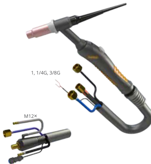
1, 1/4G, 3/8G