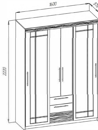
ШКАФ-КУПЕ "ОЛИМП" 4-4007