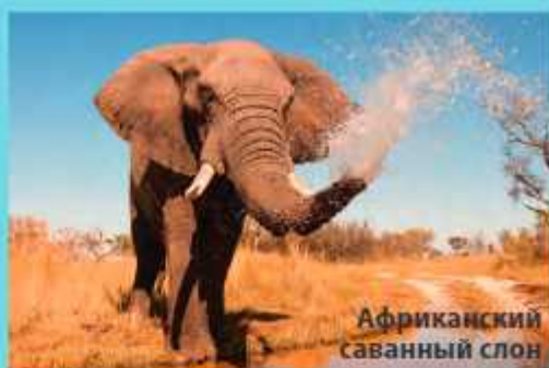
Африканский саванный слон

Хобот – удивительное приспособление! С помощью него слон не только дышит, но и берёт различные предметы. Именно хоботом животное обрывает и подносит ко рту траву и листья, которые собирается съесть. А ещё с его помощью слон принимает душ – набирает в хобот воду, а потом обрызгивает ею себя.