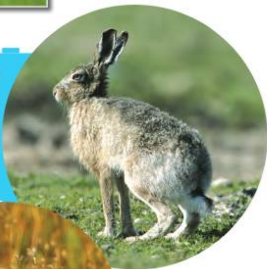
В ожидании зимы

Заяц линяет два раза в году. Его зимний наряд заметно светлее летнего, хотя и не полностью белый, как у близкого родственника, зайца-беляка. Зверёк меняет окраску шкурки, чтобы лучше прятаться от врагов.