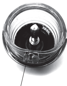
Ось стакана для специй