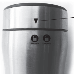
Указатель положения крышки