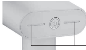
Сильная подача пара

Когда горит только левый индикатор — это означает, что установлен режим слабой подачи пара. Нажатием на кнопку «вкл/выкл», вместе с левым индикатором загорится правый индикатор — это означает, что установлен режим сильной подачи пара.