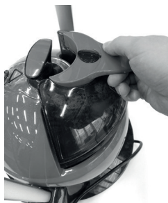
Резервуар для воды

Убедитесь, что прибор отключен от сети. Снимите резервуар с отпаривателя, взяв резервуар за ручку и потянув вверх. Откройте крышку и залейте воду, затем закройте крышку и установите резервуар обратно.