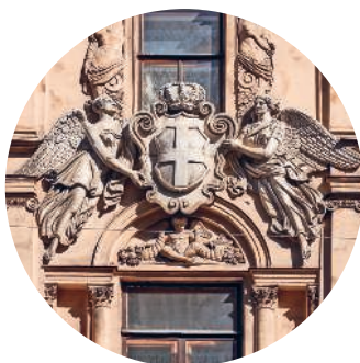
ОСОБНЯК ДЕМИДОВА (1840 г., архитектор О. Монферран) Большая Морская ул., 43