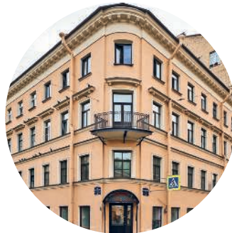
ДОХОДНЫЙ ДОМ О. ГОЛОВКИНОЙ (1840, архитектор К.-В. Винклер) ул. Достоевского, 28 / Разъезжая ул., 24