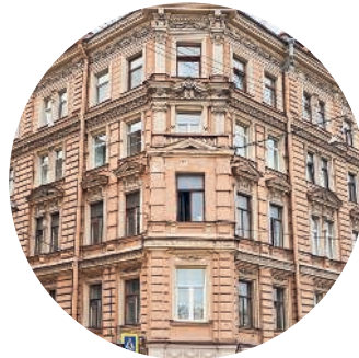
ДОХОДНЫЙ ДОМ (1881 г., архитектор А. А. Бертельс) наб. р. Фонтанки, 82 с. 159