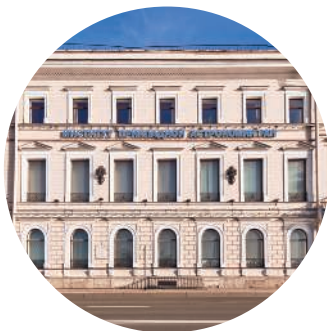
ОСОБНЯК ПАШКОВОЙ (1843 г., архитектор Г. А. Боссе) Кутузова наб., 10