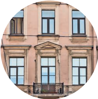
ДОХОДНЫЙ ДОМ (1860-е, архитектор Х. Х. Тацки) Литейный пр., 43