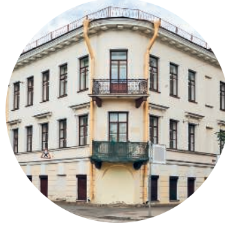
ДОМ ШАФФЕ (1885 г., архитектор В. А. Кенель) Большой пр. ВО, 17 / 5-я линия ВО, 16А с. 149