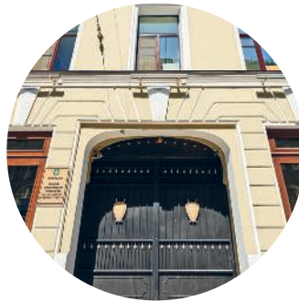
ДОМ ГЕРГЕНСА (1874 г., архитектор А. В. Шретер) Невский пр., 4 с. 229