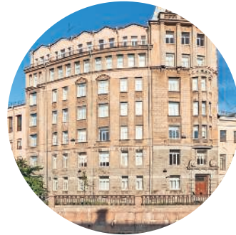
ДОМ БОГОМОЛЬЦЕВ (1913 г., архитектор О. Ф. Шульц) Грибоедова наб. к., 121