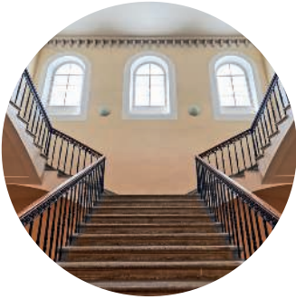
ЗДАНИЕ ДВЕНАДЦАТИ КОЛЛЕГИЙ (1742 г., архитектор Д. Трезини) Университетская наб., 7 с. 207