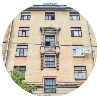
ДОХОДНЫЙ ДОМ СИДОРОВЫХ (1913 г., архитектор А. Б. Регельсон) Съезжинская ул., 22