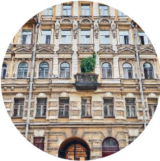
ДОХОДНЫЙ ДОМ (1882 г., архитектор А. И. Поликарпов) Верейская ул., 12