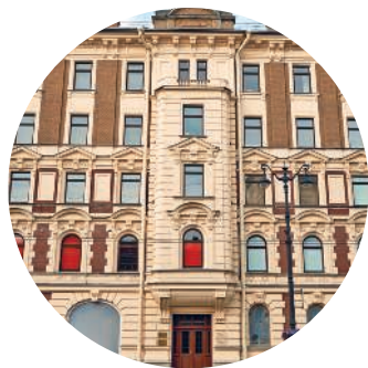
ДОХОДНЫЙ ДОМ АЛЕКСАНДРО-НЕВСКОЙ ЛАВРЫ