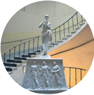
ЗДАНИЕ ОБЩЕСТВА ПООЩРЕНИЯ ХУДОЖЕСТВ (1893 г., архитектор И. С. Китнер) Большая Морская ул., 38