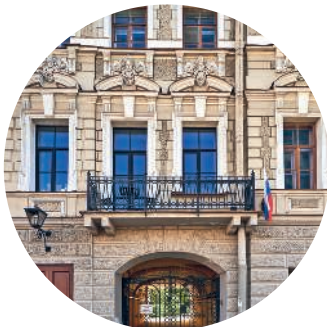
ДОХОДНЫЙ ДОМ (1875 г., архитектор И. А. Мерц) наб. р. Мойки, 10