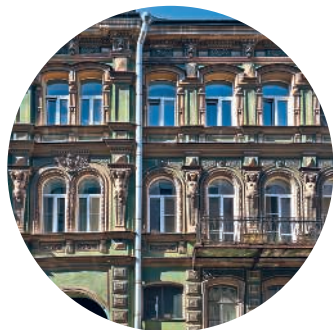
ДОХОДНЫЙ ДОМ КОНОВАЛОВОЙ (1874 г., архитектор В. М. Некора) Озерной пер., 12 с. 121