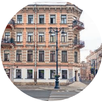
ДОХОДНЫЙ ДОМ КОКИНА (1874 г., архитектор И. И. Буланов) Невский пр. 158 / Перекупной пер., 2 с. 141