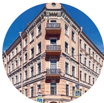
ДОХОДНЫЙ ДОМ СЕМЕНОВА