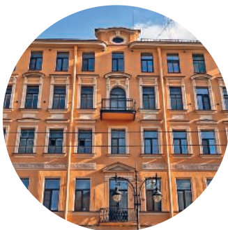
ДОМ ЩЕРБАТОВА (1909 г., архитектор И. И. Носалевич) Кирочная ул., 17