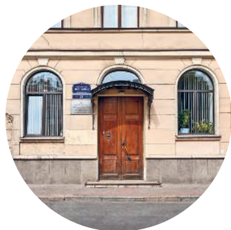
ДОМ ГУРЬЕВА (1820-е гг.) Фонтанки наб., 27 с. 109