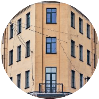
ДОХОДНЫЙ ДОМ (1875 г.) наб. Обводного канала, 128 / ул. Розенштейна, 1 с. 225