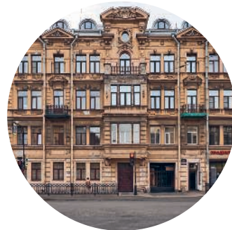
ДОХОДНЫЙ ДОМ ФЕДОРОВА (1879 г., архитектор В. Е. Стуккей) ул. Марата, 20