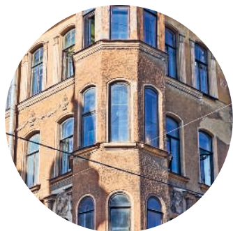
ДОХОДНЫЙ ДОМ (1910 г., архитектор М. И. Серов) Некрасова ул., 6 / Короленко ул., 1