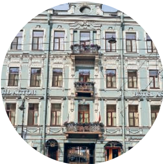
ДОМ МАЛОЗЁМОВА (1873 г., архитектор К. А. Кузьмин) Владимирский пр., 5