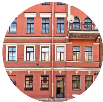
ДОХОДНЫЙ ДОМ НИКИТИНОЙ (1861 г., А. Ф. Занфтлебен) Манежный пер., 6 / Радищева пер., 2 с. 133