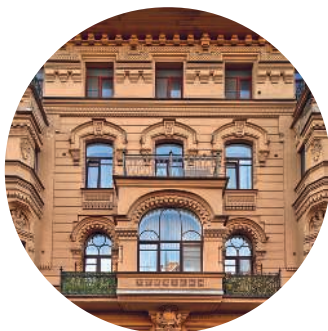
ДОХОДНЫЙ ДОМ ЗАЙЦЕВЫХ (1877 г., архитектор И. С. Богомолов) Фурштатская ул., 20