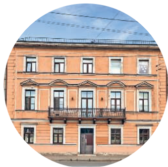
ОСОБНЯК ДИНГЕЛЬШТЕТА (1849 г., архитектор Б. Б. Гейденрейх) пр. Римского-Корсакова, 63 с. 97