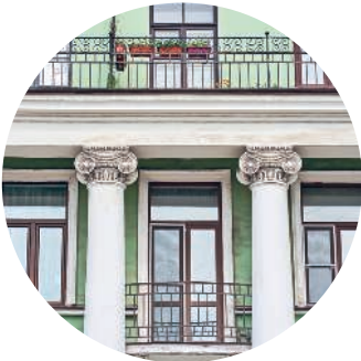
ДОМ КУКАНОВОЙ (1832 г., архитектор А. И. Мельников) Гороховая ул., 50 / Фонтанки наб., 79 с. 155