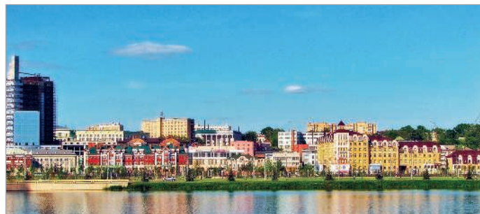
■ Панорама озера Кабан