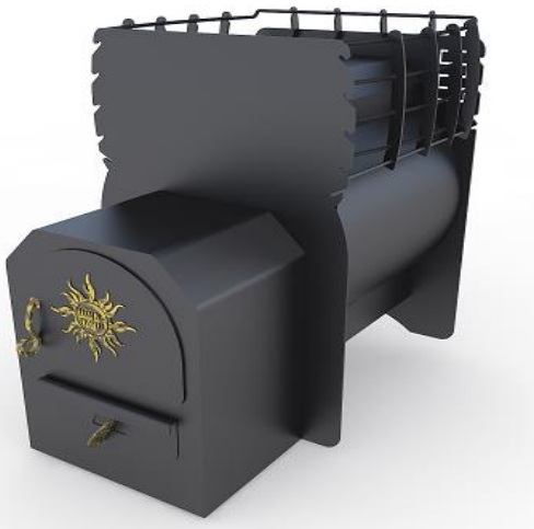
рис. 3 Затяя