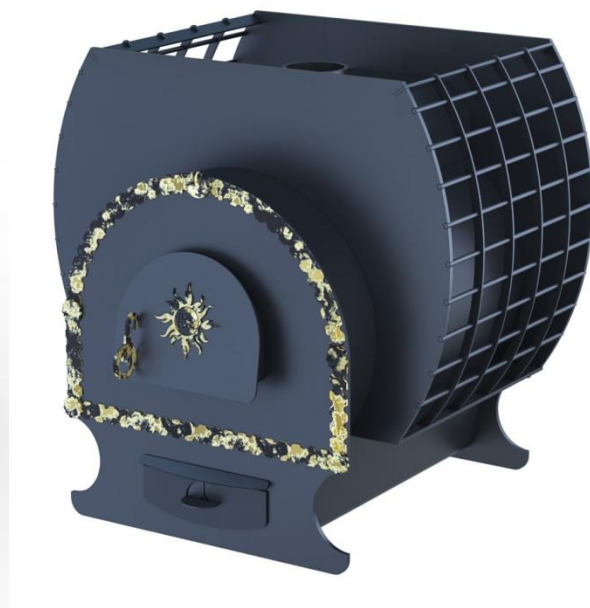
рис. 6 Добрыня 1