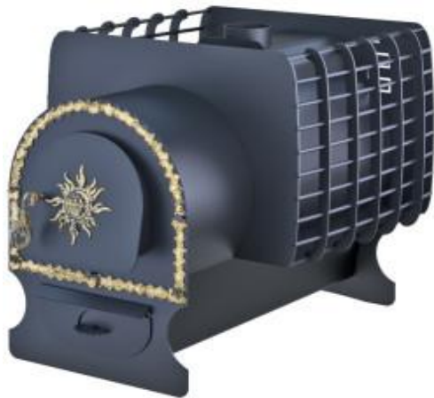
рис. 7 Святогор