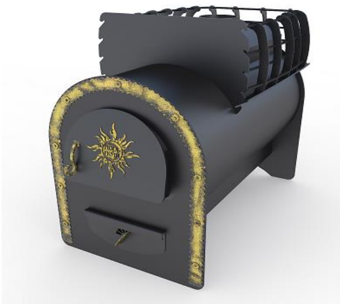
рис. 5 Горыня