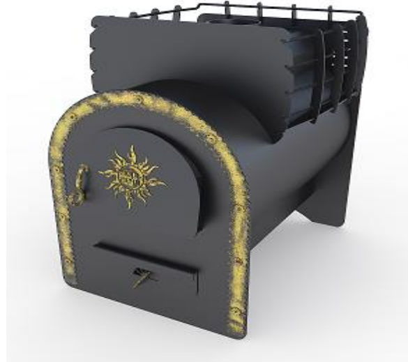
рис 2 Забава