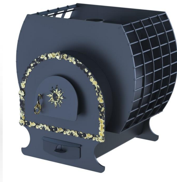
рис. 6 Добрыня 1