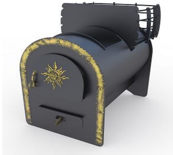
рис. 4 Любаня