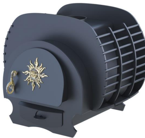
рис. 8 Малуша