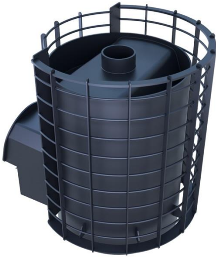
рис. 1 Вольга