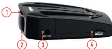
СХЕМА УСТРОЙСТВА РАДАР-ДЕТЕКТОРА