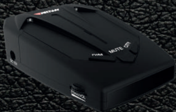
АВТОМОБИЛЬНЫЙ РАДАР-ДЕТЕКТОР RD-516