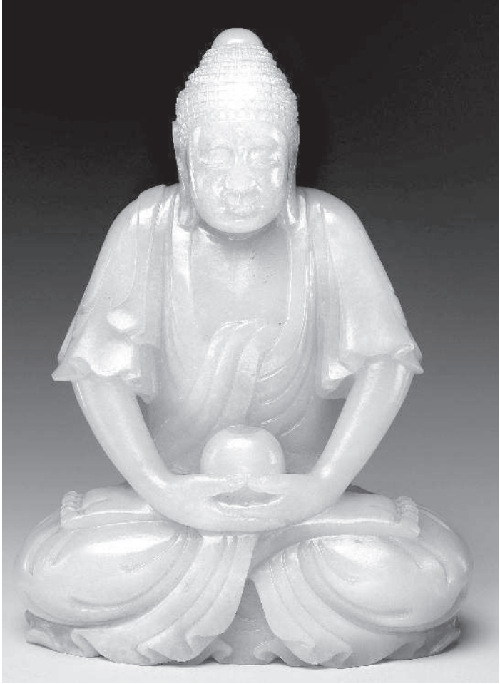
Китайская статуэтка сидящего будды. Нефрит. XVIII в. Метрополитен-музей, Нью-Йорк

Из нефрита даже изготавливали бляшки, которые были в ходу наравне с монетами.