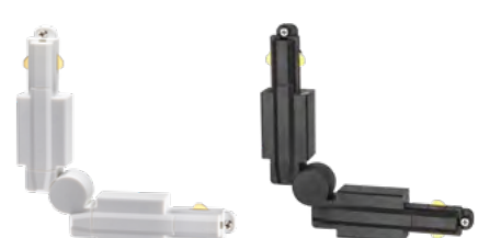
135020 белый 135021 черный

135112 IP 20 Крепление для встраиваемого монтажа однофазного шинопровода Металл (Д*Ш*В) 60,6*105,9*18 мм