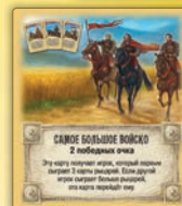
Самое большое войско