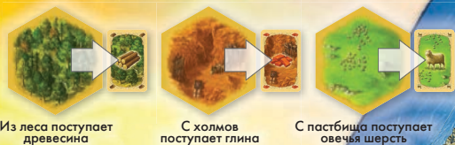
Из леса поступает древесина

2 На острове есть пустыня и ещё пять разновидностей ландшафта: каждый из них приносит доход в виде ценного сырья.