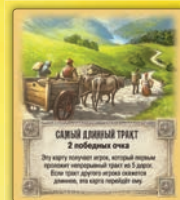
Самый длинный тракт