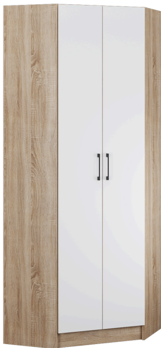
Схема сборки изделия Прихожая «Денвер» Шкаф угловой 2150*800/800*380