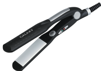
GL4501 ЩИПЦЫ ДЛЯ ВОЛОС