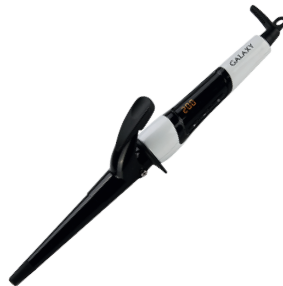
GL4614 ПЛОЙКА КОНУСНАЯ