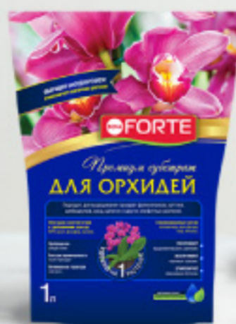
Субстрат для ОРХИДЕЙ, 1 л