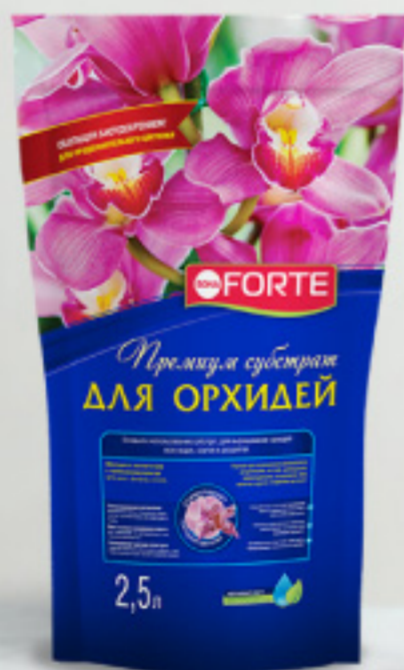
Субстрат для ОРХИДЕЙ, 2,5 л