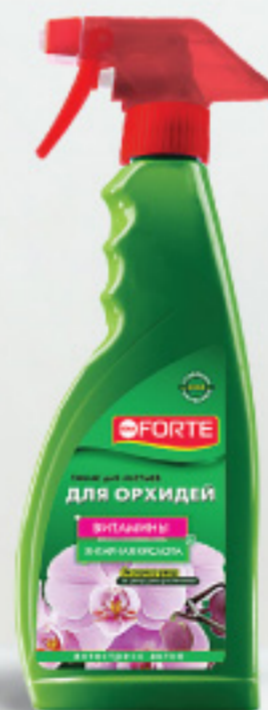
Тоник для ОРХИДЕЙ, 500 мл