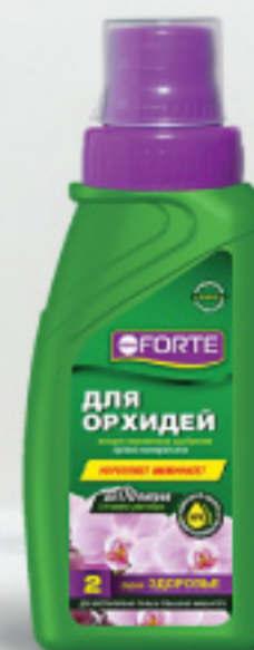
Удобрение для ОРХИДЕЙ серия ЗДОРОВЬЕ, 285 мл