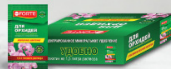
Удобрение для ОРХИДЕЙ, саше 10 мл