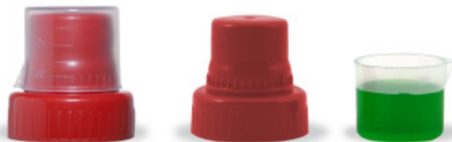
Удобный мерный колпачок .

→ В зимний период цветущие растения подкармливать надо 1 раз в неделю