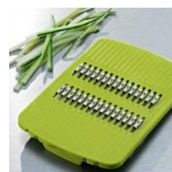
Насадка с лезвием мелкая соломка