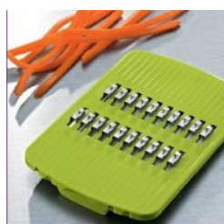
Насадка с лезвием крупная соломка