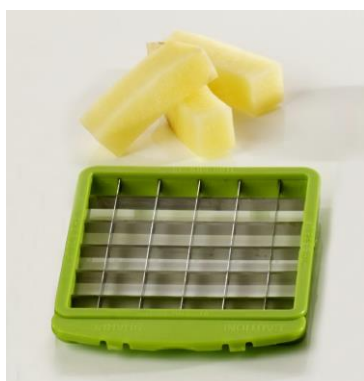
Нож-решетка для крупной нарезки