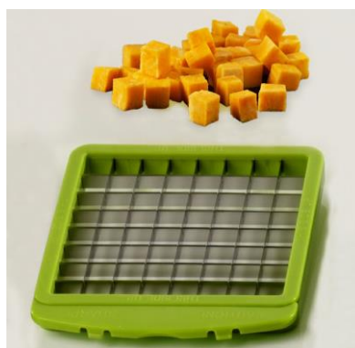
Нож-решетка для мелкой нарезки