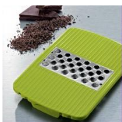
Насадка с лезвием мелкая терка