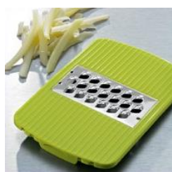
Насадка с лезвием крупная терка