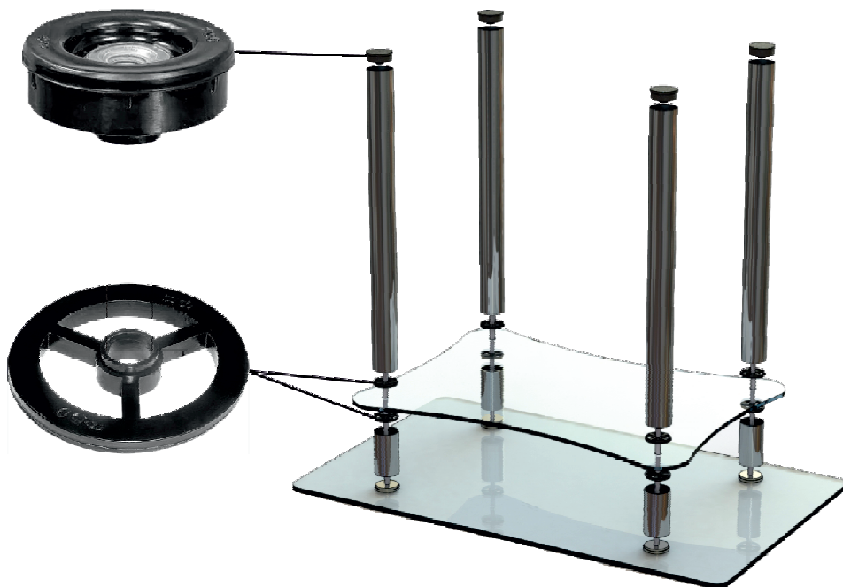
Схема транспортировочной сборки «ноги»