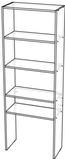
Схема сборки Стеллаж "Элемент 1" 1770x632x294мм

ВНИМАНИЕ! Проверить наличие деталей и фурнитуры в комплекте, до начала сборки.