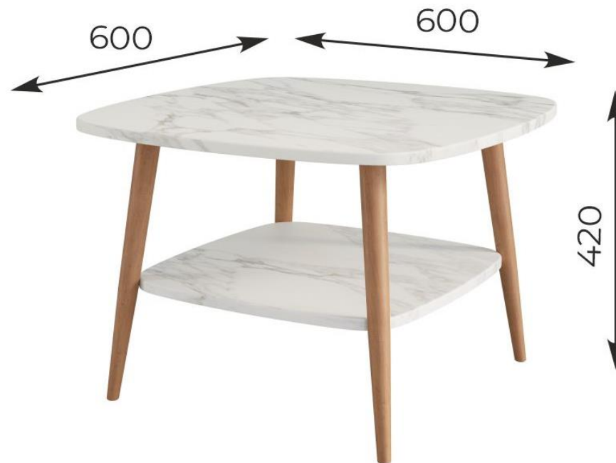
Стол журнальный «КВАДРО»