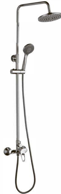
СМЕСИТЕЛЬ ДЛЯ ДУША «ТРОПИЧЕСКИЙ ДОЖДЬ»

В комплекте к смесителю прилагается паспорт изделия и гарантийный талон.