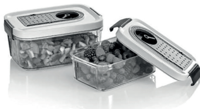
Контейнер для вакуумирования (в комплектацию не входит, приобретается отдельно)