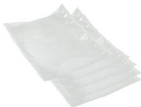
Пакеты для вакуумирования (5 шт.)