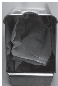
Пакетик с активированным углем, вложенный в носик

Сначала установите крышку, а потом подставьте канистру под выпускной патрубок. Если сделать наоборот, то патрубок может упереться в крышку или бортик отверстия на канистре, и при нажатии на крышку вы что-нибудь сломаете.