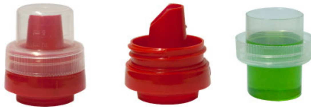
Удобный мерный колпачок .

После окончания срока годности удобрение не теряет агрономической ценности.