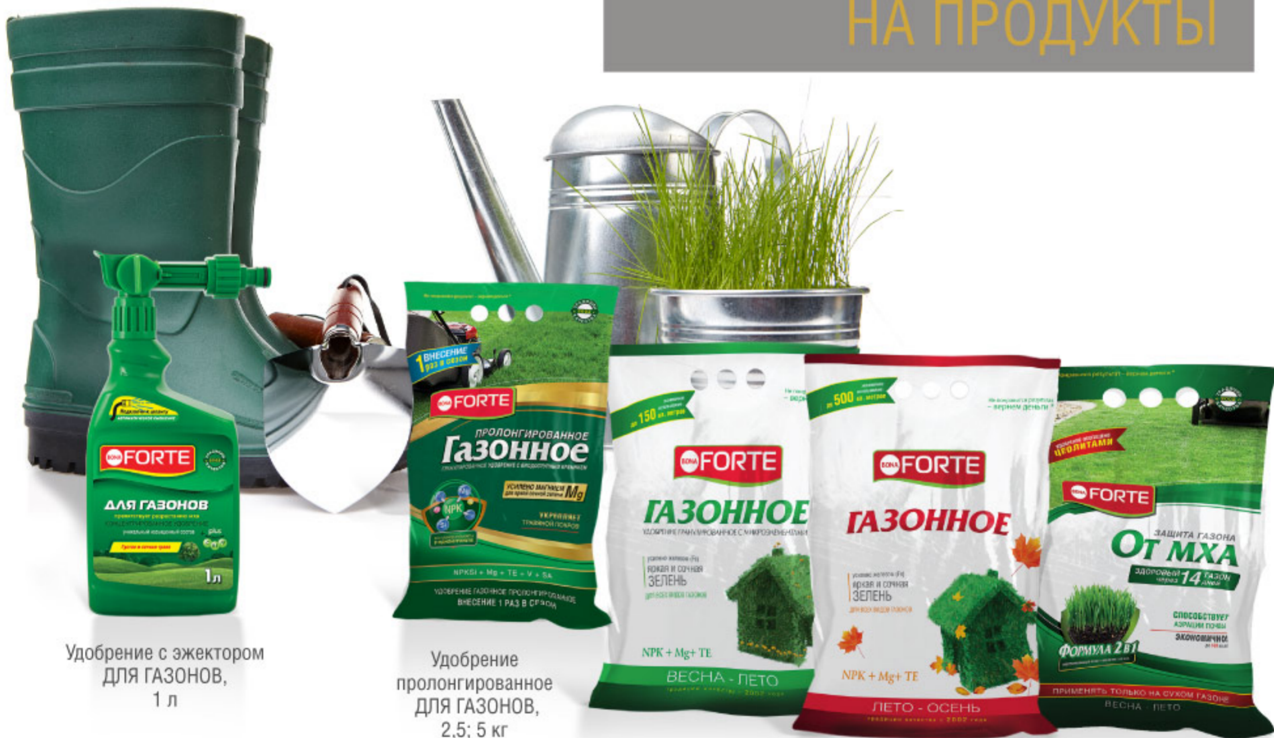
Удобрение с эжектором для ГАЗОНОВ, 1 л