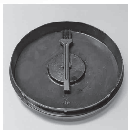
Щетка для чистки