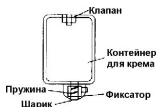
Рис.2. Контейнер для крема