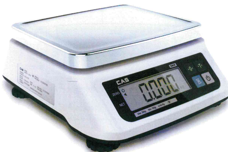
Рисунок 1 - Общий вид весов

Общий вид весов представлен на рисунке 1.