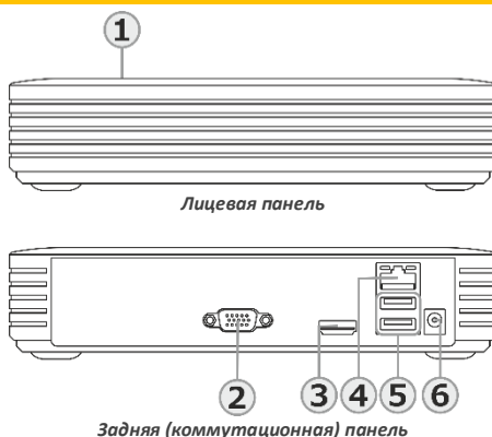
Задняя (коммутационная) панель