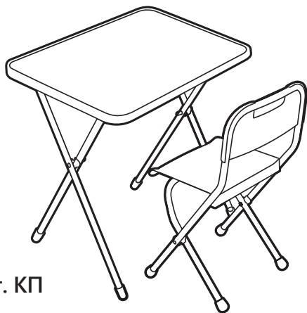
(рис. 1) арт. КП