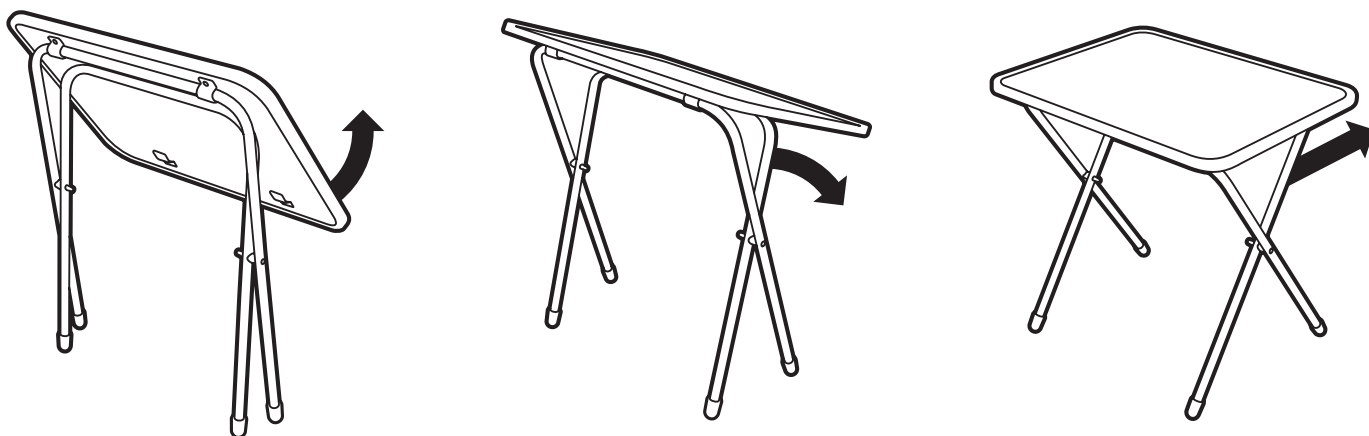
(рис. 3) Схема раскладывания стола

подпись ответственного лица, штамп торгующей организации