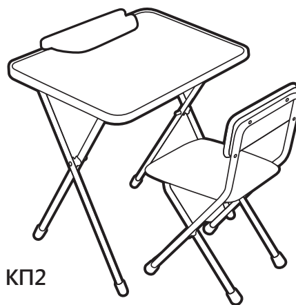
(рис. 2) арт. КП2

Перед эксплуатацией следует ознакомиться с паспортом и руководством по эксплуатации. Следуя инструкции, выполните установку стола и стула.