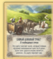
Самый длинный тракт