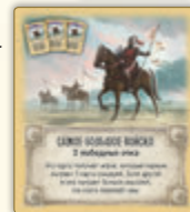
Самое большое войско