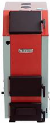
«Магнум» - 30 с автоматикой