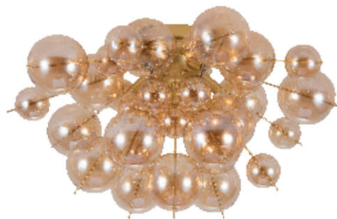
1 Артикул: A8313PL-5GO Ø60 | 133 5x40W | G9