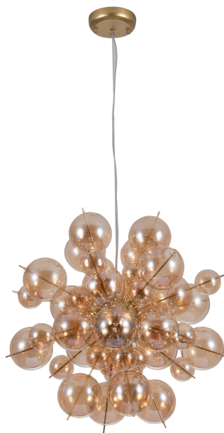
1 Артикул: A8313SP-6GO Ø52 | 152 40W | G9