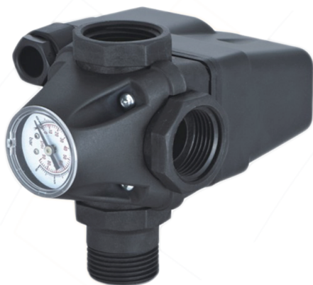
PS-04A РЕЛЕ ДАВЛЕНИЯ