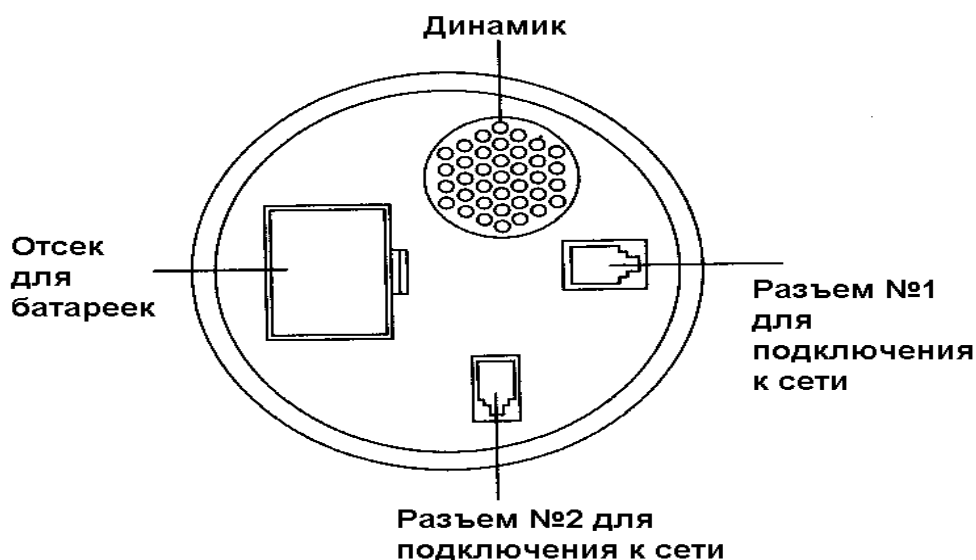
Схема панели управления: