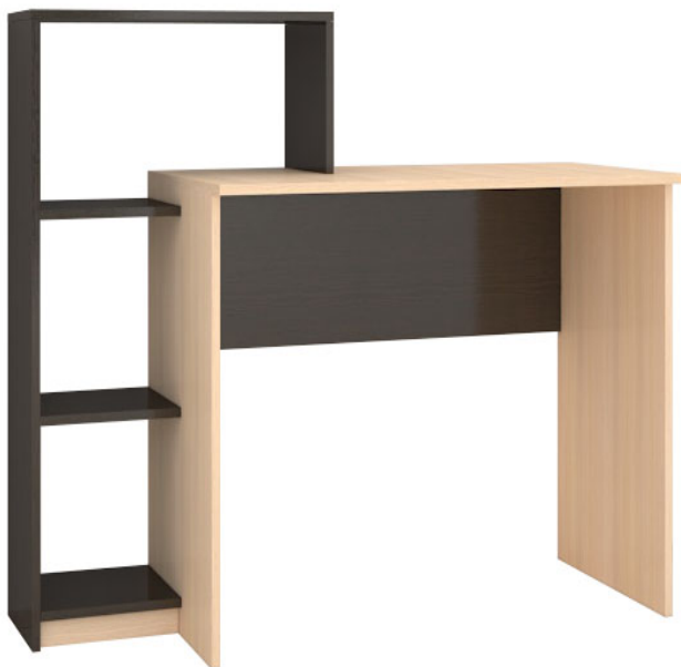
Схема сборки изделия Компьютерный стол «Квартет-2» 1020*1250*500 (ВхШхГ)

Рекомендуется пользоваться услугой по сборке квалифицированных специалистов, имеющих пригодные для этих целей оборудование, инструмент, а также необходимые знания и навыки.