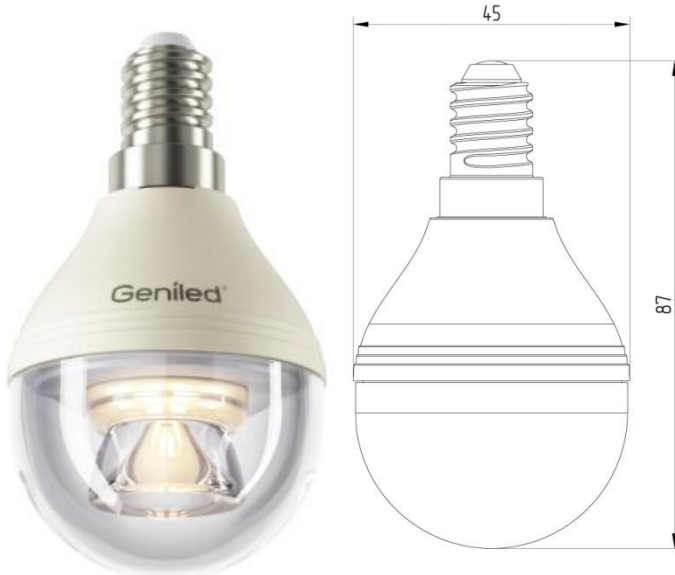
Рисунок 1 – Внешний вид.

Светодиодная лампа Geniled E14 G45 8W - со светодиодами повышенной яркости NationStar SMD 3528. Эффективный теплоотвод достигается за счет плотного соединения светодиодной платы с алюминиевым радиатором, который покрыт теплопроводящим пластиком. Колба лампы выполнена из ударопрочного прозрачного поликарбоната. Лампа используется в светильниках и бра с цоколем E14 в качестве замены традиционных ламп типа «шарик».