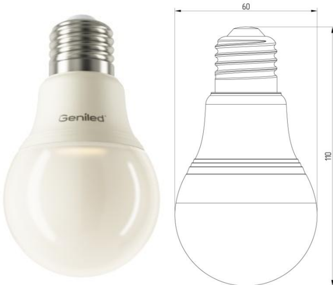
Рисунок 1 – Внешний вид.

Светодиодная лампа Geniled E27 A60 10W - со светодиодами повышенной яркости NationStar SMD 3528. Эффективный теплоотвод достигается за счет плотного соединения светодиодной платы с алюминиевым радиатором, который покрыт термопроводящим пластиком. Колба лампы выполнена из ударопрочного матового поликарбоната. Лампа используется в светильниках и бра с цоколем E27 в качестве замены традиционных ламп типа «груша».