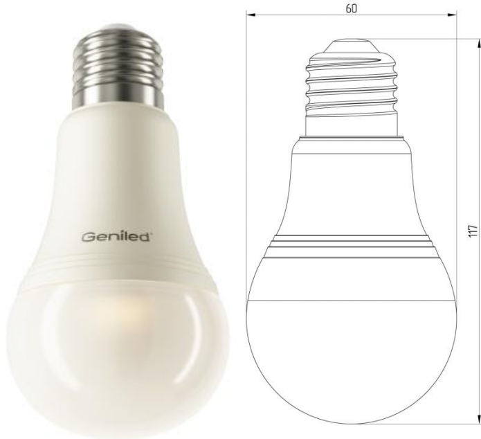
Рисунок 1 – Внешний вид.

Светодиодная лампа Geniled E27 A60 16W - со светодиодами повышенной яркости NationStar SMD 3528. Эффективный теплоотвод достигается за счет плотного соединения светодиодной платы с алюминиевым радиатором, который покрыт термопроводящим пластиком. Колба лампы выполнена из ударопрочного матового поликарбоната. Лампа используется в светильниках и бра с цоколем E27 в качестве замены традиционных ламп типа «груша».