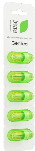
Рисунок 2 – Внешний вид упаковки.

Примечание: не пригодна для использования совместно со стандартными регуляторами уровня яркости.