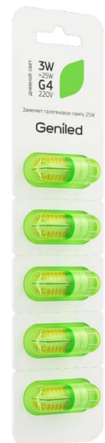
Рисунок 2 – Внешний вид упаковки.

Примечание: не пригодна для использования совместно со стандартными регуляторами уровня яркости.