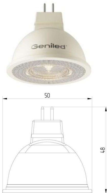
Рисунок 1 – Внешний вид.

Светодиодная лампа Geniled GU5.3 MR16 8W - со светодиодами повышенной яркости NationStar SMD 3528. Эффективный теплоотвод достигается за счет плотного соединения светодиодной платы с алюминиевым радиатором, который покрыт термопроводящим пластиком. Оптический рассеиватель лампы выполнен из ударопрочного матового поликарбоната. Лампа используется в светильниках с цоколем GU5.3 в качестве замены традиционных ламп типа MR16.