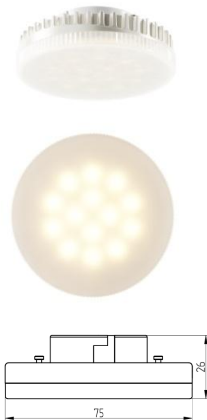
Рисунок 1 – Внешний вид.

Светодиодная лампа Geniled GX53 6W используется в накладных, встраиваемых светильниках в качестве замены люминесцентных ламп «таблеток» с цоколем GX53. Корпус выполнен из алюминия, пластика и матового поликарбоната.